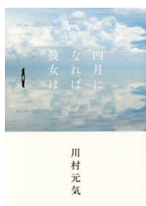
四月になれば彼女は 川村 元気 著

「語学には才能が必要」「現地に留学しなければ上達しない」「検定試験の点数が大事」「日本人は巻き舌が下手」といった間違った「語学の常識」に振りまわされず、楽しく勉強を続けるには。外国語学習法としての言語学入門。