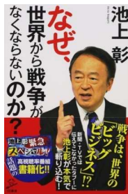
なぜ、世界から戦争がなくなるのか? 池上 彰 著

「戦争はいけないこと」とみんなが言っているのに、どうしてなくなるのか? この質問に、あなたならどう答えますか? 戦争は世界のビッグビジネスだ!?! 21世紀の戦争は「お金を得るための戦争」だった? これまで誰も指摘してこなかった、「資本主義社会における“戦争”の位置づけ」に池上彰が切り込む!