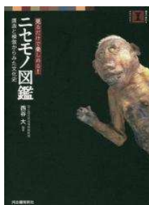
見るだけで楽しめる! ニセモノ図鑑 贋造と模倣からみた文化史 西谷 大 編著

消費者の多くは期限を1日でも過ぎた食品は捨て、店では棚の奥の期限が先の商品を選ぶ。小売店も期限よりかなり前に商品を撤去。その結果、日本はまだ食べられる食品を大量に廃棄する「食品ロス」大国となっている。しかも消費者は知らずに廃棄のコストを負担させられている。食品をめぐる「もったいない」構造に初めてメスを入れた衝撃の書。