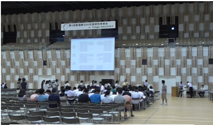
700人以上の高校生が参加しました(アオーレ長岡)

アオーレ長岡で行われた、第4回新潟県SSH生徒研究発表大会に「スターリングエンジン」班3年生5名がステージ発表、ポスター発表、生徒交流会に参加しました。