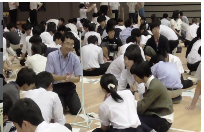
他校との交流会では着地後の構造物の高さ競います（ペーパードロップ）