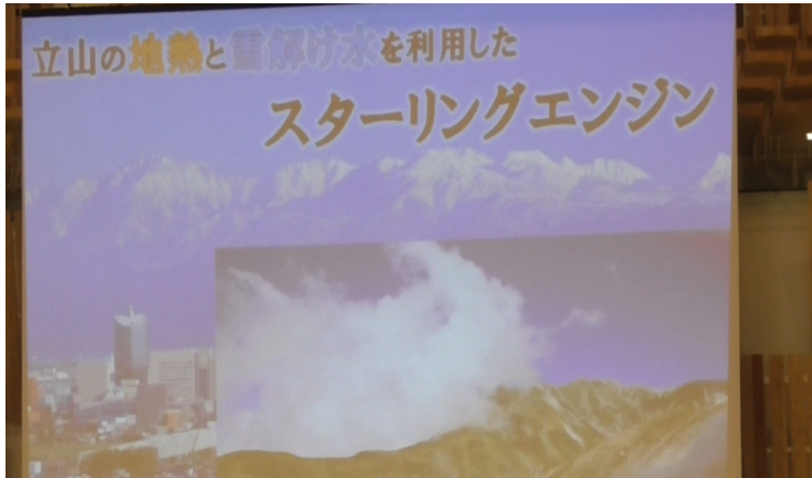
ステージ発表のスライド（日本語です）