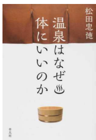
温泉はなぜ体にいいのか

井伊家を救うため男名前を名乗り領主として活躍し、後の徳川四天王・井伊直政を育て上げた井伊直虎。その生涯と彼女の生きた時代を徹底解説する。史蹟ガイド・年表も収載。2017年NHK大河ドラマ「おんな城主 直虎」がよりいっそう楽しめる1冊。