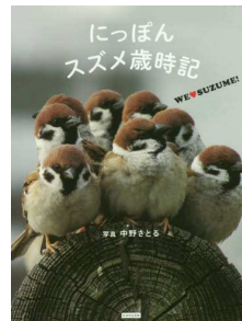
にっぽんスズメ歳時記

日本唯一の温泉学教授が「科学的な温泉の効用」に本格的に取り組み、その最新成果をわかりやすく解説。温泉の尽きぬ魅力と楽しみ方、利用法、さらに温泉との関りの歴史などを紹介する。