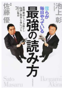
僕らが毎日やっている 最強の読み方 池上 彰 / 佐藤 優 著

池上彰氏、佐藤優氏は毎日「何を」「どう」読んでいるのか？ どうすれば、彼らのように「自分の力で世の中を読み解ける」のか？ 「普通の人ができる方法」をやさしく具体的に解説。重要ポイントがすぐわかり、読みやすく、記憶に残る。具体的な新聞・雑誌リスト、おすすめサイト・書籍を紹介。見るだけで参考になる！