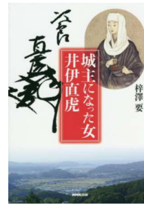
城主になった女 井伊直虎 梓澤 要 著

池上彰氏、佐藤優氏は毎日「何を」「どう」読んでいるのか？ どうすれば、彼らのように「自分の力で世の中を読み解ける」のか？ 「普通の人ができる方法」をやさしく具体的に解説。重要ポイントがすぐわかり、読みやすく、記憶に残る。具体的な新聞・雑誌リスト、おすすめサイト・書籍を紹介。見るだけで参考になる！