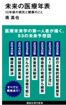
未来の医療年表 10年後の病気と健康のこと 奥 真也 著

新薬、革新的な医療技術や医療機器、先進各国で導入されている先端的な医療の仕組みの数々を紹介。日本人の医療リテラシーの欠如について問題提起し、閉鎖的で自己完結的な日本の医療と「世界標準の医療」を比較する。