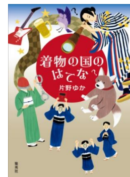
着物の国のはてな 片野 ゆか 著

世界で最も重要な固体・砂は、現代文明の土台をなす物質である。人類が砂なしで生きていけなくなるまでに、なにがあったのか。文明を支える砂よりも頑丈な土台はあるのか。一粒の砂から、人類社会の全体像を浮かび上がらせる。