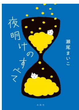
夜明けのすべて 瀬尾 まいこ 著

堅苦しくて、面倒そうで、複雑怪奇なルールに満ちた「着物の国」。着物を着ると、なぜ老けて見える？ 着物警察を撃退する方法とは？ いつ誰が、着物の“格”を決めたのか？ 着物初心者のノンフィクション作家が、着物を取りまくモヤモヤを解き明かす。