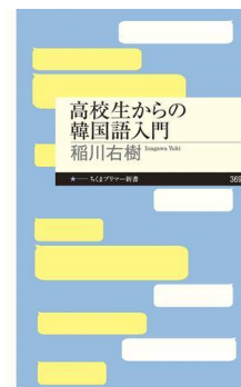
高校生からの韓国語入門 稲川 右樹 著

「センセイ、どうして鳥の研究をするんですか？」 「楽しいから。他に理由が必要かい？」NHK子ども科学電話相談でお馴染み「バード川上」センセイは、今日も崖をよじ登り、荒波を乗り越え溶岩に行く手を阻まれる——。『鳥類学者だからって、鳥が好きだと思うなよ。』から続く抱腹絶倒の日々を描く待望の第二弾。