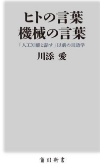
ヒトの言葉 機械の言葉 「人工知能と話す」以前の言語学 川添 愛 著

AIと普通に話せる日はくるのか。人工知能と向き合う前に心がけるべきことは何か。私たちは「言葉の意味とは何か」を理解しているのか。AIが発達しつつある今、言葉とは何かを問い直し、言葉の不思議と未解決の謎に迫る。